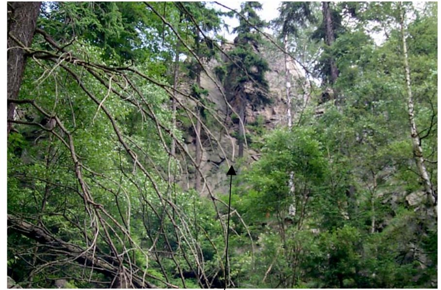
Talseite 3. Pfeiler